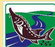
美深町 Bifuka Town