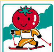
和寒町 Wassamu Town