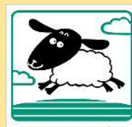
士別市 Shibetsu City

※掲載地図は編集者が作成したものです。実際の境界・縮尺と違う場合がありますが、ご了承ください。