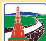
下川町 Shimokawa Town