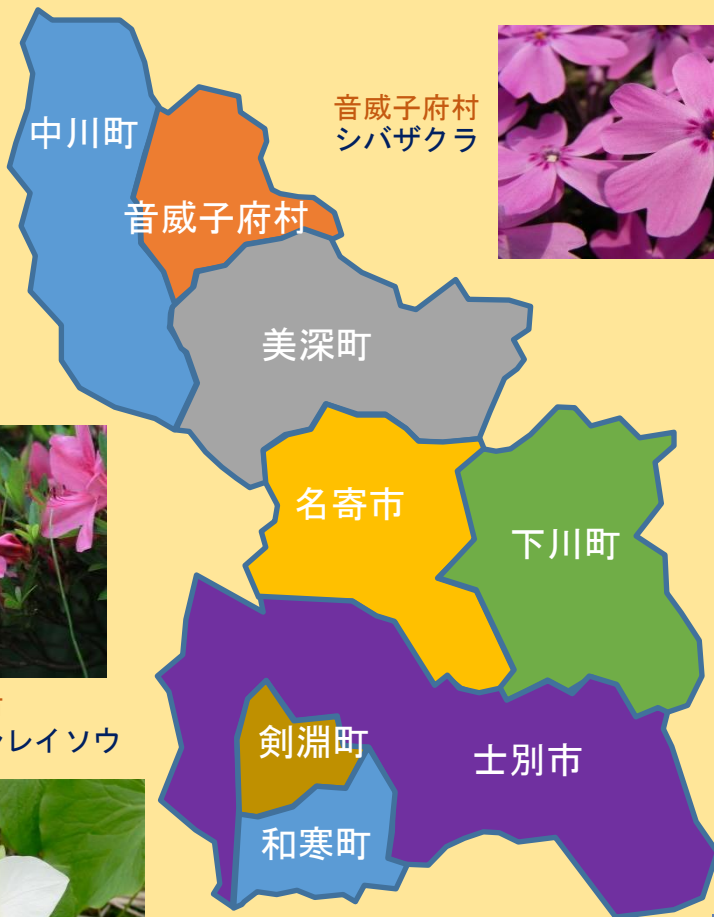
音威子府村 シバザクラ