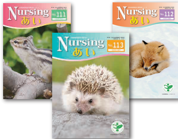
看護協会十勝支部が定期的に発行している「Nursing あい」