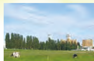
北大農場とポプラ並木

北海道大学 保健センター 〒060-0816 札幌市北区北16条西17丁目 TEL：011-706-5346