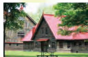
札幌農学校第2農場